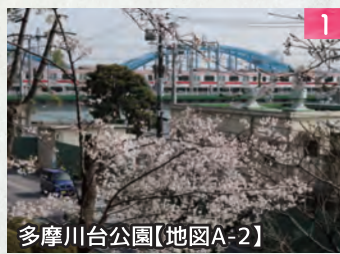
多摩川台公園【地図A-2】