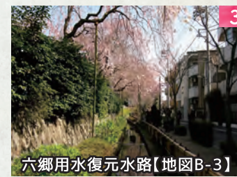
六郷用水復元水路【地図B-3】