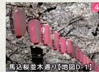
馬込桜並木通り【地図D-1】