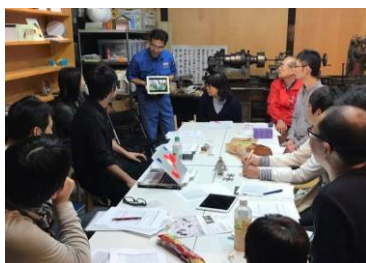
職人有志が企画するイベントでのクリエイターとのデザイン連携