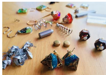
町工場で出た廃材をアクセサリの素材に活用