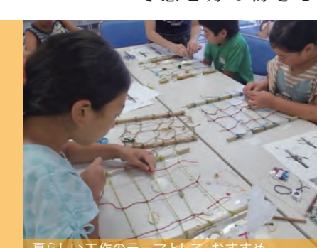
夏らしい工作のテーマとして、おすすめ。