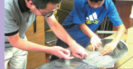
とんびのかたちを骨組みを曲げて作るところが難しい。 http://www.city.ota.tokyo.jp/seikatsu/manabu/hakubutsukan/