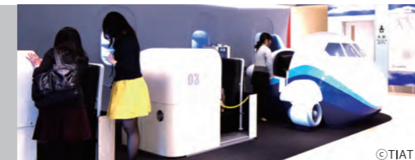
仮想飛行を体験して、パイロットの偉大さを実感できる。