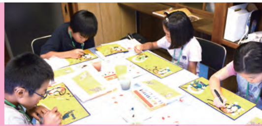
一度館内をぐるりと巡ってみてから描いてみるとよいかも。