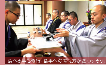
食べる事も修行。食事への考え方が変わりそう。