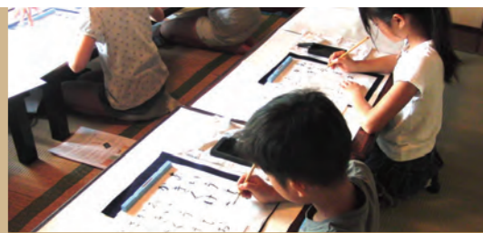
自分にとって大切な一語を「うちわ」に書いてみては。

馬込文士村に今もある、女流かな書の第一人者・熊谷恒子の旧宅。そこで体験する「かな」の創作。