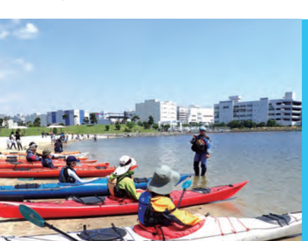
乗り方、パドルの使い方、そして「安全」も学べる。